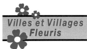
Jean-Pierre BERTRAND Maire de Plan-de-Cuques

Espace d'expression réservé aux élus n'appartenant pas à la majorité municipale. (en application de l'article L2121-27-1 du code Général des Collectivités Territoriales)